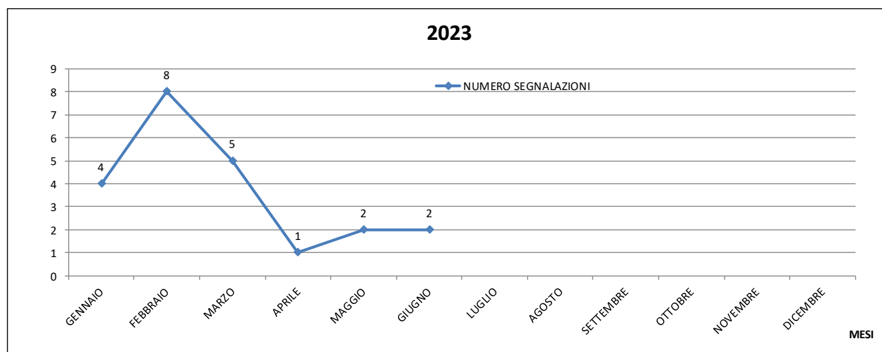
Fig. 2 - Rappresentazione grafica del numero delle segnalazioni dei cittadini che collaborano al progetto di monitoraggio degli odori tra Lizzana e zona industriale nella prima parte del 2022.

Da notare la mancanza di corrispondenza coi nasi umani anche nei momenti in cui il naso elettronico ha percepito dei segnali odorosi particolarmente elevati, come il giorno 29 aprile alle 17:45 quando l'intensità relativa indicata era attorno al 36. Ma anche in altri momenti, come in diverse giornate a giugno, quando si sono verificati episodi particolarmente intensi e in particolare al 16 di giugno quando la carica odorosa, secondo il Pen3Meteo, sarebbe durata per una decina di ore dalla notte fino alle tre del pomeriggio raggiungendo un picco di intensità relativa pari a 22. 2