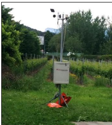
Fig. 1. Posizione della centralina di misura in via Pederzini a Lizzana.

Dal 21 maggio 2019 il naso elettronico col rilevatore meteo si trova posizionato in via Pederzini a Lizzana (Fig. 1). Si sottolinea come le misure raccolte dalla strumentazione risentano fortemente della posizione in cui la stessa è installata, sia per il fatto di essere più vicina a una sorgente piuttosto che a un'altra, sia per l'andamento prevalente dei venti. Tutto ciò influenza l'intensità di odore misurato e la prevalenza di alcune sorgenti rispetto ad altre.