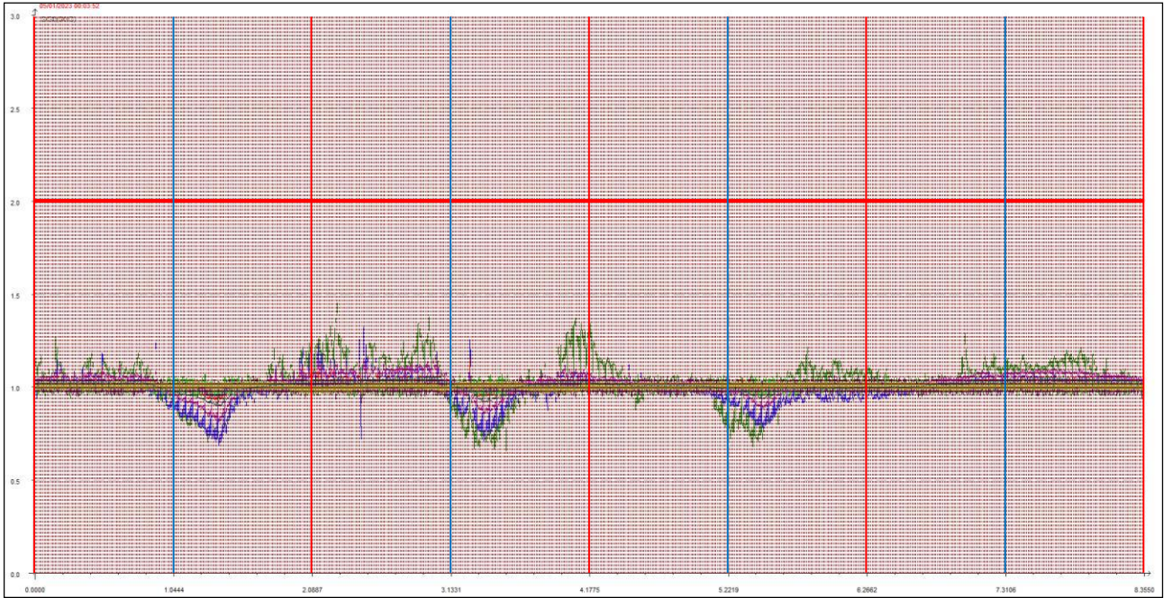
Giornate dal 5 all'8 gennaio 2023