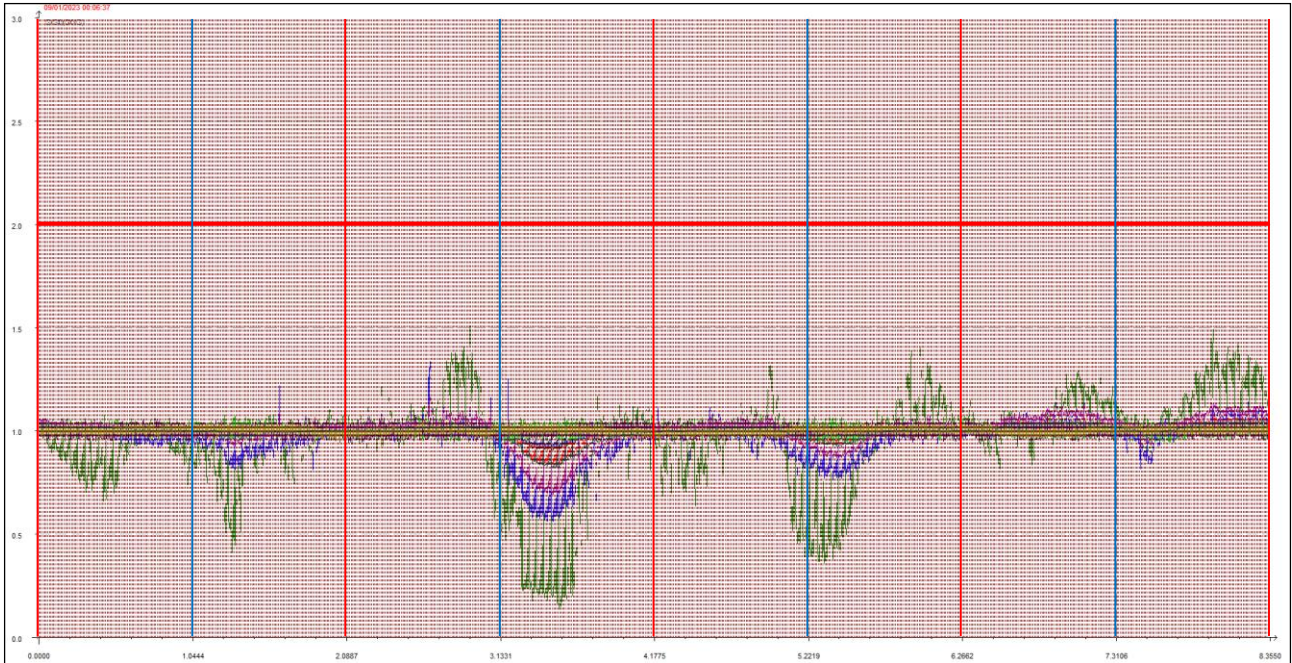
Giornate dal 9 al 12 gennaio 2023